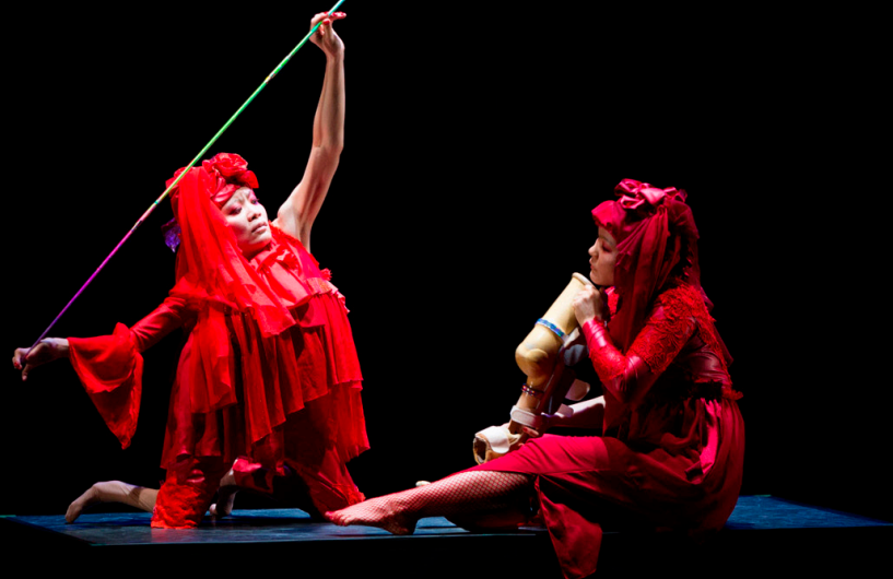
『Onna Matsumushi(女松虫)』