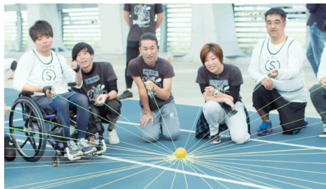
道具を使って全員で1つのことを成し遂げるワーク