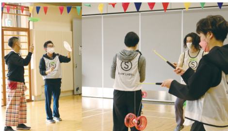
スカーフ、ボール、お皿などサーカス道具を使うワーク