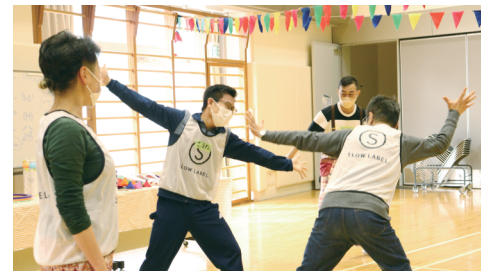
身体を使ってコミュニケーションをとるワーク