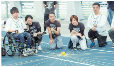
道具を使って全員で1つのことを成し遂げるワーク