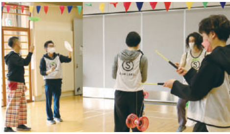
スカーフ、ボール、お皿などサーカス道具を使うワーク