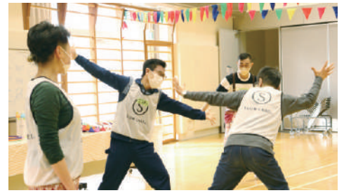
からだを使ってコミュニケーションをとるワーク